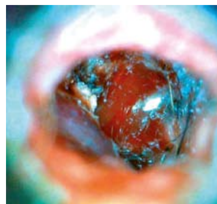
2. kép: repedt dobhártya, otitis media, cochlearis promontorium vérzés