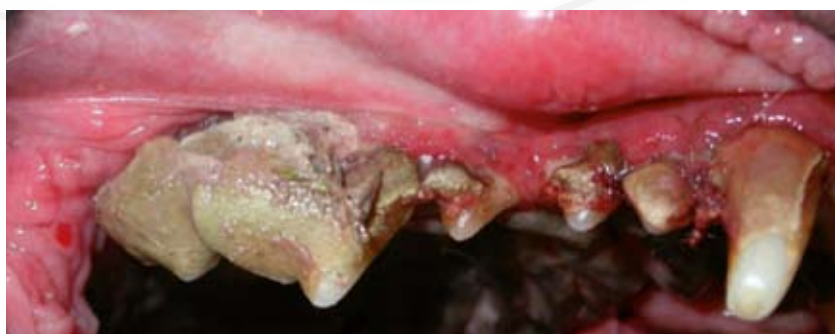
Műtét előtt készült fényképek: szembevető fogkőesség, gingivitis és periodontitis.