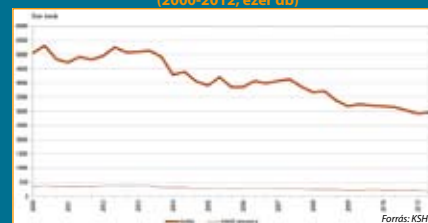
1. ábra: A sertés- és anyakoca-állomány alakulása (2000-2012, ezer db)

Ráadásul két vágó-feldolgozó üzem idén beszünteti a pulykavágást és ezt a kapacitás-csökkenést a többi üzem várhatóan nem tudja pótolni. Mindezek miatt a pulykalétszám további csökkenése várható. A LÚD ágazatban az alacsony keltetésszám és a még mindig